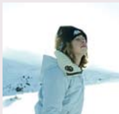
SVEZIA LA VITA AL POLO NORD My, 23 anni

“In India passo il tempo con i miei amici, fuori a cena o nei locali o al cinema. Ho lavorato per qualche mese in un’agenzia che organizza eventi, correndo su e giù come una matta; mi è piaciuto molto perché ha stimolato la mia creatività. Del mio Paese e della mia città, Delhi, ora sento nostalgia del cibo e delle opere d’arte. Delhi è un posto di enorme importanza storica con monumenti straordinari. Un’altra delle cose belle è la multiculturalità: ci sono diverse comunità religiose e molte tradizioni gastronomiche. Ma se guardo al mio futuro, mi immagino di vivere in una città dal respiro internazionale. In Italia mi trovo bene, perché la gente è accogliente e amichevole e coesistono un vecchio e un nuovo mondo. Ovunque ti giri, respiri storia proprio come in India”.